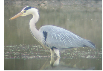
Héron cendré (R. Lorrillière)

Nous vous rappelons que fin 2007, ce sont les programmes personnels sur les pétrrels, cormorans, hérons, canards, gruiformes, plus ceux démarrés fin 2005 – début 2006, qui doivent renvoyer le formulaire de bilan complété.