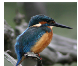
Martin pêcheur (JP Moussus)

D'autre part, Jean-Pierre s'intéressera aux variations de la spécialisation pour l'habitat d'une espèce en fonction de sa localisation dans son aire de répartition. Ceci pourra être mis en relation avec les dynamiques de colonisation /extinction notamment au niveau des limites d'aires pour cerner quelles sont les populations à risque. Enfin, afin de donner encore davantage de poids à ces études de portée nationale, une intégration à l'échelle européenne de ces résultats, notamment en ce qui concerne la productivité des espèces, est envisagée en collaboration avec les programmes type STOC capture d'autres pays européens.