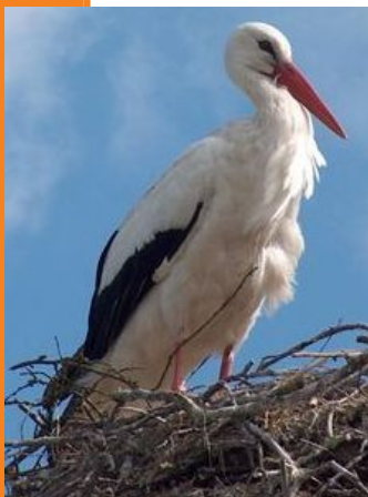
Cigogne Blanche (D. Colin)

Deux changements à noter en 2008 dans le PNRO :