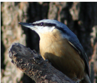
Sittelle torchepot (JP Moussus)

Les enjeux du travail de thèse de J.P. Moussus seront, à partir des données émanant des deux STOC, de mettre en évidence les réorganisations de communautés d'oiseaux dictées par les changements globaux.